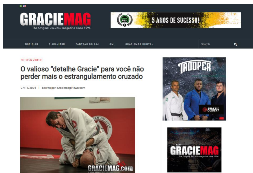
Figura 6- Captura de tela do site Gracie Mag : O valioso detalhe Gracie