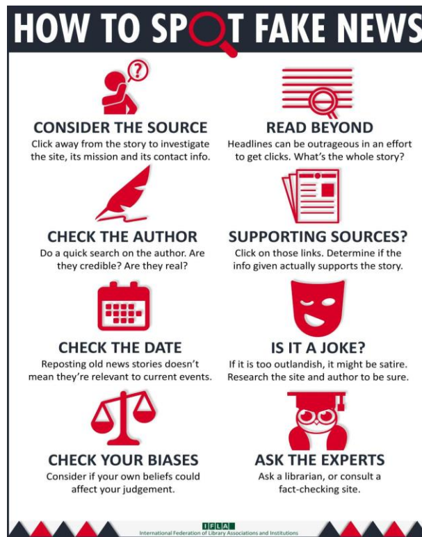
Figura 1- How to spot fake news.