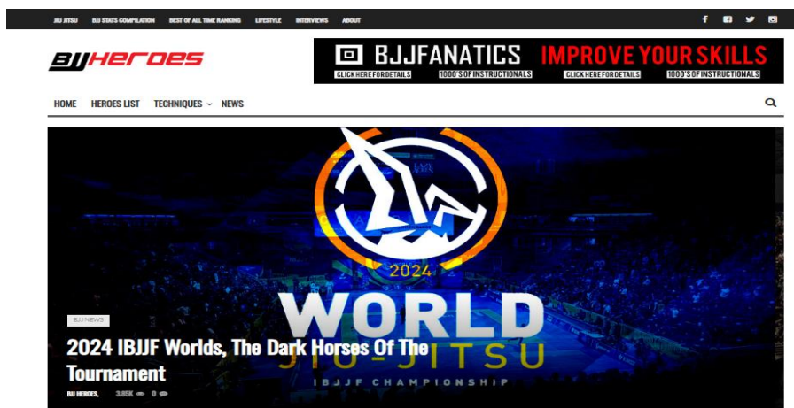
Figura 4- Captura de tela do site BJJ Heroes: 2024 IBJJF Dark Horses