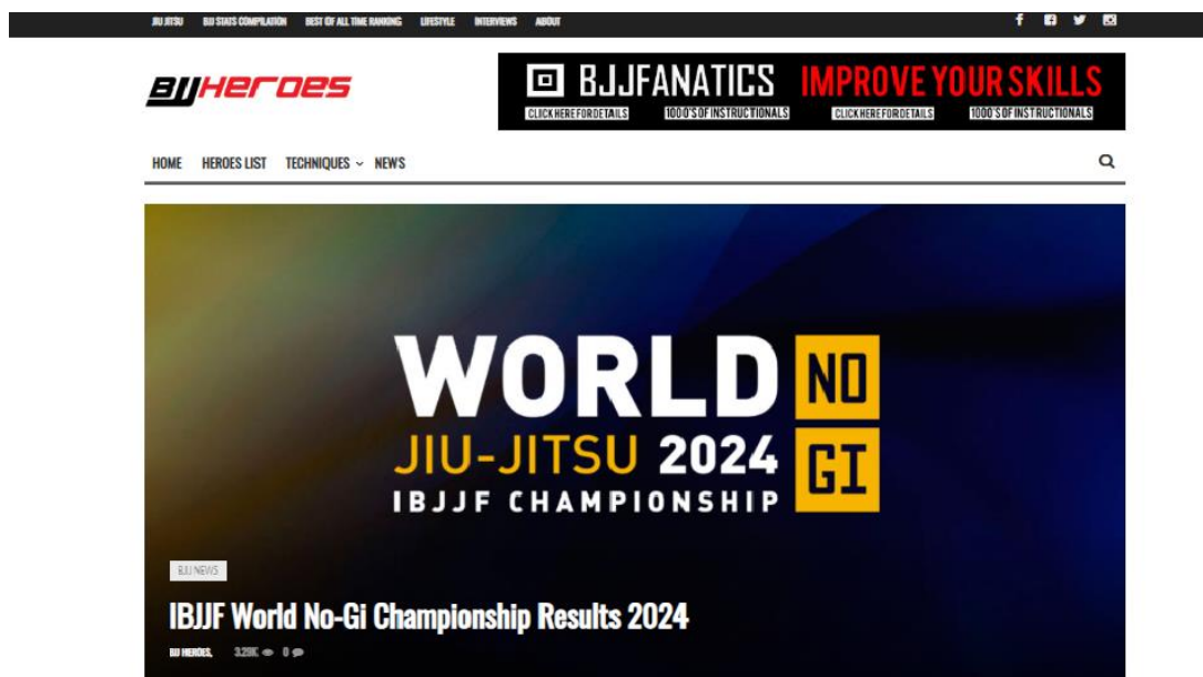
Figura 8- Captura de tela do site BJJ Heroes: IBJJF World No-Gi Results