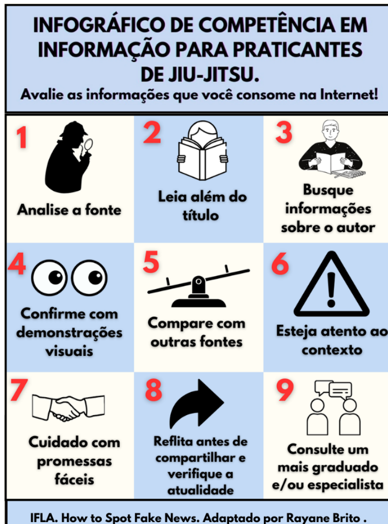
Figura 5: Infográfico de Competência em Informação para praticantes de jiu-jitsu