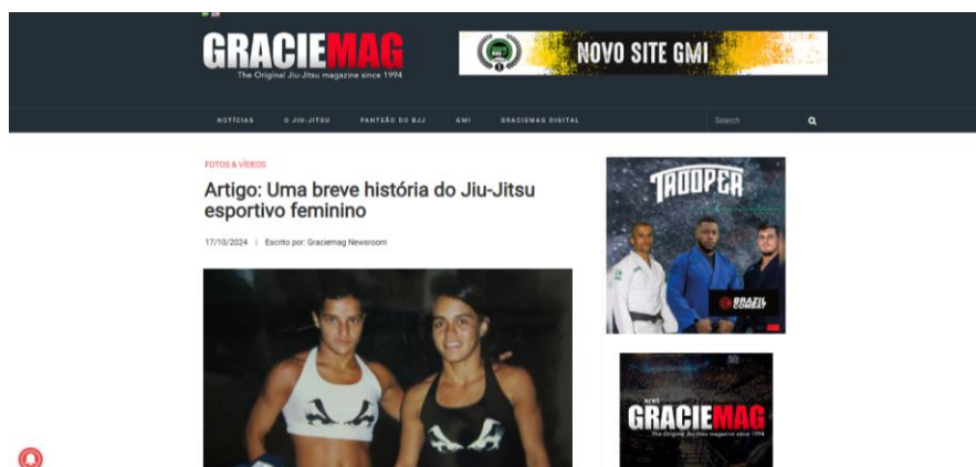
Figura 2- Captura de tela do site Gracie Magazine: Uma breve história do jiu-jitsu esportivo feminino.

Fonte: Graciemag. Disponível em: https://www.graciemag.com/artigo-uma-breve-historia-do-jiu-jitsu-esportivo-feminino/ . Acesso em: 10 dez. 2024.