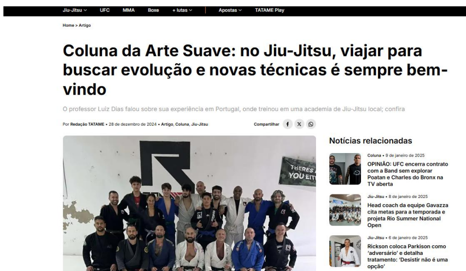
Figura 7- Captura de tela do site Revista Tatame : Coluna da Arte Suave